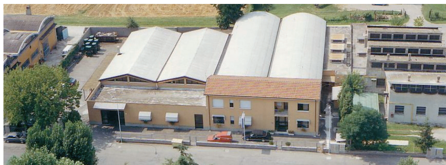
Fondata nel lontano 1936, dal 1963 Fem ha la propria sede e stabilimento a Cadriano. Nelle foto in basso, una fase del processo produttivo e parte delle attrezzature utilizzate per la realizzazione di cerniere speciali.

fiche per ogni tipo di applicazione. Dal 1963, dopo l'acquisizione dell'intero pacchetto societario da parte